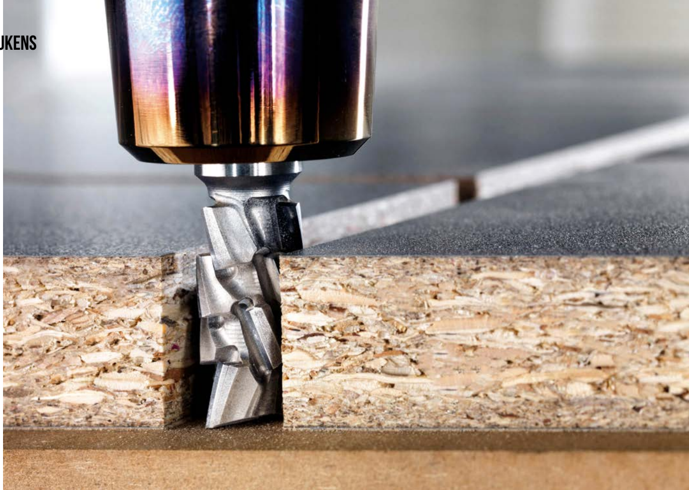
Dankzij onze specifieke oplossing is afwerking met 20 meter per minuut op het hoogste niveau mogelijk. (Beeld: Bovenfrees Diamaster)

Tekst: Rob Buchholz Beeld: Leitz & Culimaat